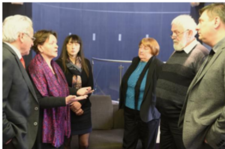
Une fois n'est pas coutume, la minorité a voté contre cette décision de fermeture des collèges.

« Il aurait été plus simple de mettre la poussière sous le tapis, d'attendre que l'Éducation nationale nous soumette ses prescriptions. Je n'ai pas fait ce choix. J'assume mes responsabilités. »